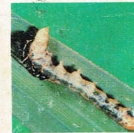
16. Parasit Larva Hama Putih Palsu (dewasa)