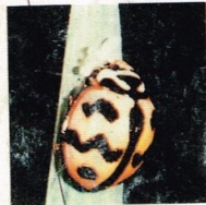
8. Kumbang Coccinelid (dewasa)