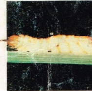
17. Parasit Larva Hama Putih Palsu (larva)