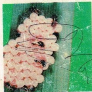
19. Parasit Kelompok telur Kepinding Tanah.