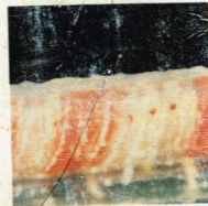
15. Parasit Kelompok telur Wereng Coklat