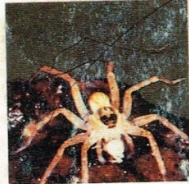
2. Laba-laba pemburu- Lycosa