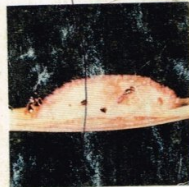
14. Parasit Kelompok telur penggerak batang