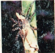
1. Laba-laba pemburu- Lycosa