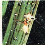
4. Laba-laba pembuat jaring- Tetragnatha