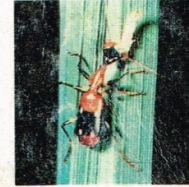
6. Kumbang Carabid