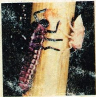
7. Kumbang Coccinelid (larva)