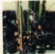
20. Patogen Wereng Coklat (jamur)