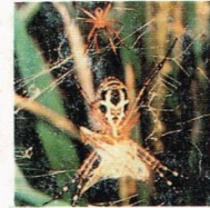
5. Laba-laba pembuat jaring- Argiope