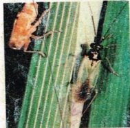
9. Kepinding Buas