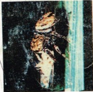
3. Laba-laba pemburu- Phidippus