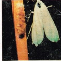
9. Hama Putih