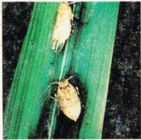
1. Wereng Coklat