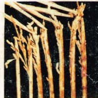
21. Busuk Pelepah