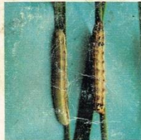
13. Ulat Grayak