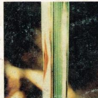
19. Bakteri Hawar Daun (Kresek)