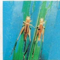
15. Belalang Daun