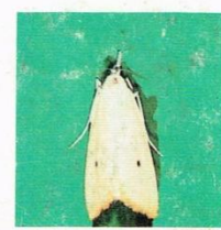
5. Penggerek Batang Padi kuning.