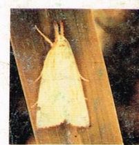
6. Penggerek Batang Padi Kepala Gelap