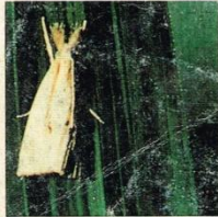
7. Penggerek Batang Padi Bergaris