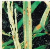
23. Bercak Coklat