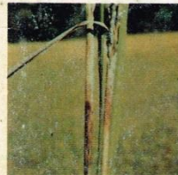
22. Hawar Pelepah