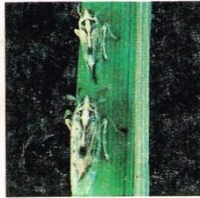
2. Wereng Punggung Putih