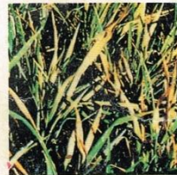
20. Virus Tungro