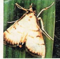
10. Hama Putih Palsu (Dewasa)