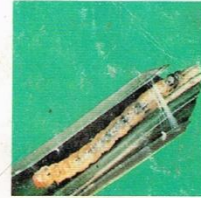
11. Hama Putih Palsu (Larva)