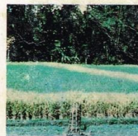
18. Tikus (Kerusakan)