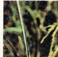
12. Hama Putih Palsu (Kerusakan).