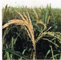
8. Penggerek Batang padi (Kerusakan "Beluk")