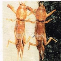
14. Anjing Tanah