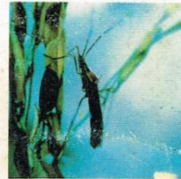
16. Walang Sangit