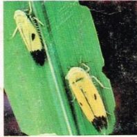
3. Wereng Hijau